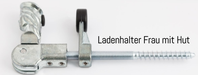
Ladenhalter Frau mit Hut